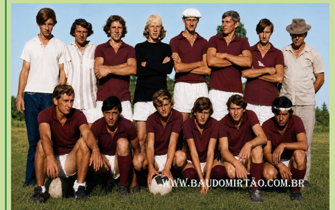
EQUIPE: OS BOYS F. C. (1975)