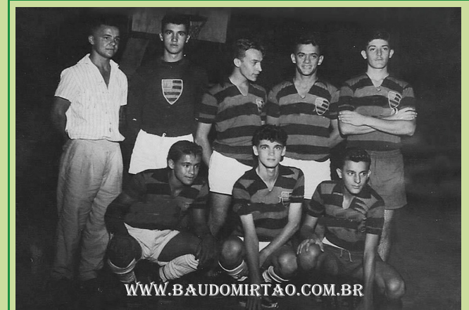
EQUIPE: CERD (1960)